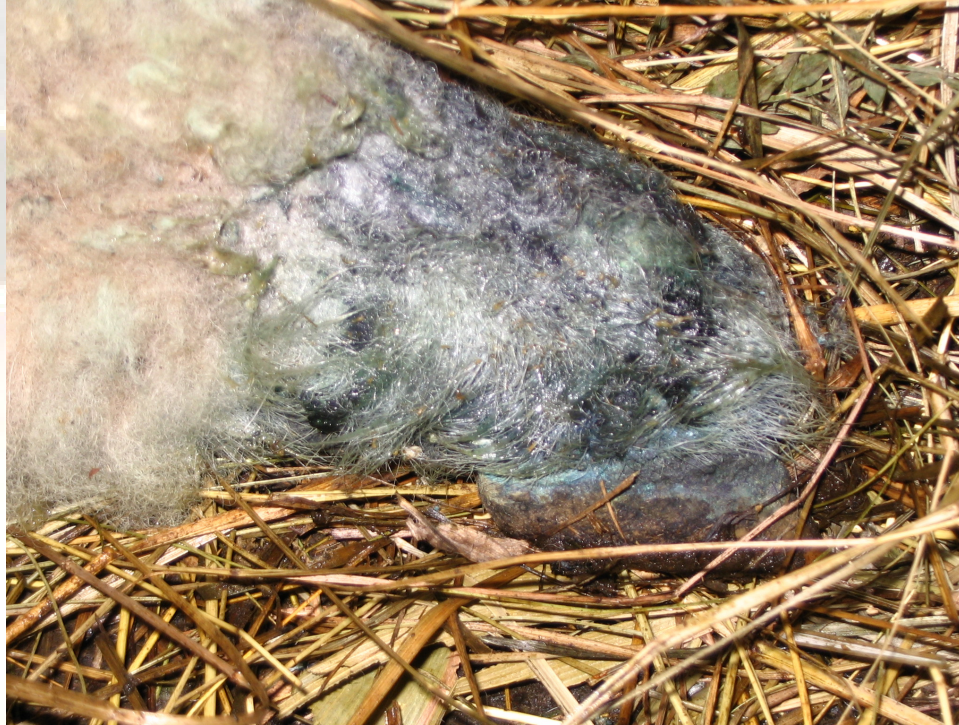
„kéklábú birka” (Kép: 2)