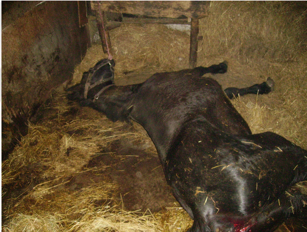
Kimerült kanca. (Kép: 9)