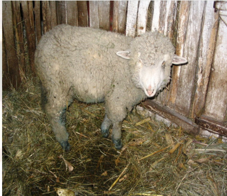
„kéklábú birka” (Kép: 1)